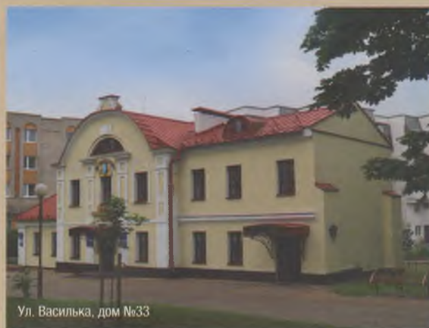
Ул. Василька, дом №33