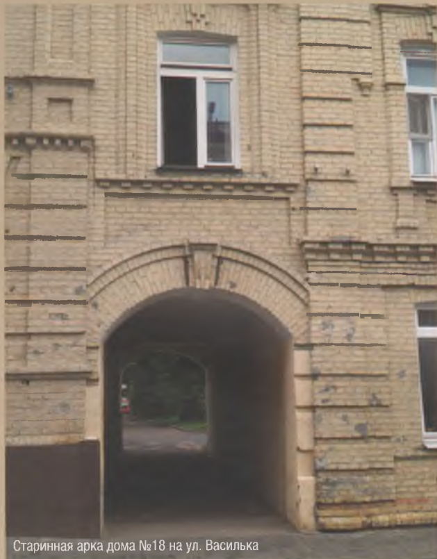
Старинная арка дома №18 на ул. Василька