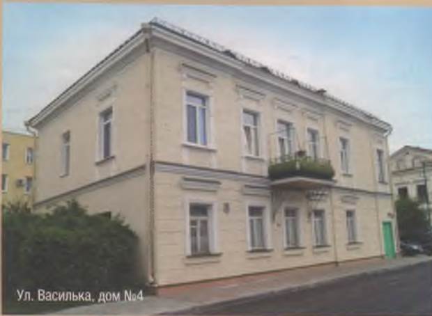
Ул. Василька, дом №4