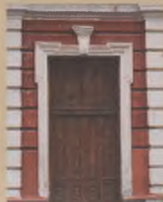
Старинные двери дома №10 на ул. Василька