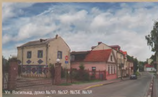
Ул. Василька, дома №30, №32, №34, №38