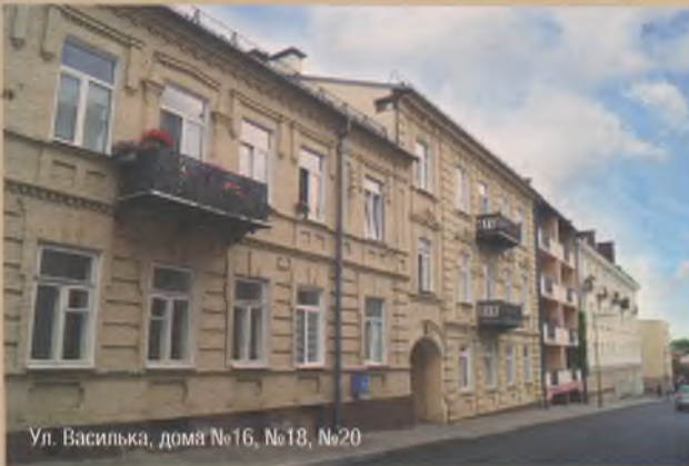
Ул. Василька, дома №16, №18, №20