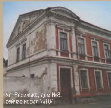
Ул. Василька, дом №8, сейчас носит №10/1