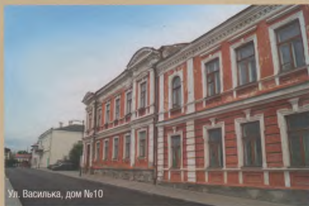
Ул. Василька, дом №10

Главной достопримечательностью улицы сегодня является дом №18, в котором некоторое время проживала Элиза Ожешко. Он был построен в 1888 году из кирпича в стиле эклектики и в 1900 году соединён в единый архитектурный ансамбль с пристроенным к нему домом №16. Тот был украшен тремя балконами с литыми чугунными ограждениями. Между домами